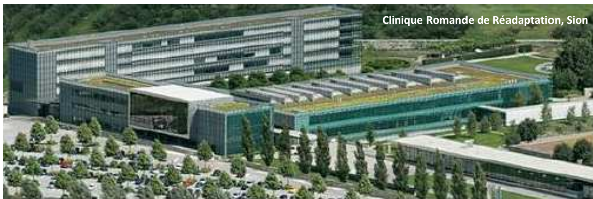
Clinique Romande de Réadaptation, Sion

A la fin du mois de juin et afin de suivre au plus près l'évolution de leur condition physique, tous les athlètes masculins du NLZ Ouest se sont soumis à une batterie de tests de performance à la Clinique Romande de Réadaptation SUVA à Sion. Outre la visite médicale, effectuée dans le cabinet du Dr. Fournier, les athlètes ont réalisé les tests suivants :