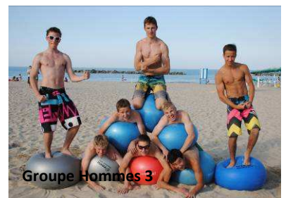
Groupe Hommes 3