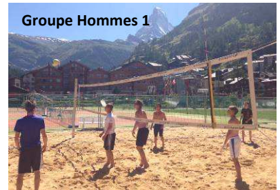
Groupe Hommes 1

Ils ont pour objectifs d'obtenir soit un diplôme de commerce, soit une maturité professionnelle commerciale, soit une maturité gymnasiale (orientation économie et droit).