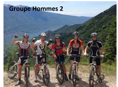
Groupe Hommes 2